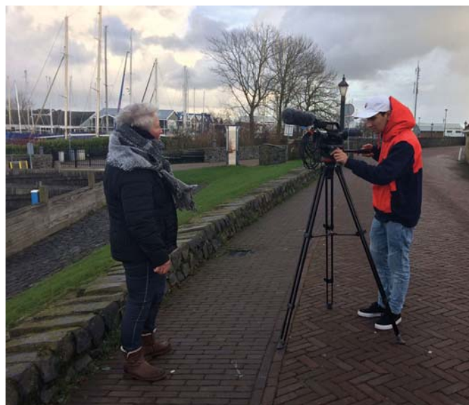
Het maken van de filmpjes

In de bubbel kunnen bezoekers kiezen uit video's over onze cultuur; van de Friese taal tot sport, over het verleden en de toekomst. Alle video's zijn gemaakt door jongeren uit onze gemeente. Gewapend met hun smartphone maken scholieren van het voortgezet onderwijs filmpjes. Daarvoor kregen zij een workshop 'filmen met je smartphone'. Projectbureau Link (Friese Poort) zorgt voor het communicatieplan en de bezetting van de bubbel.