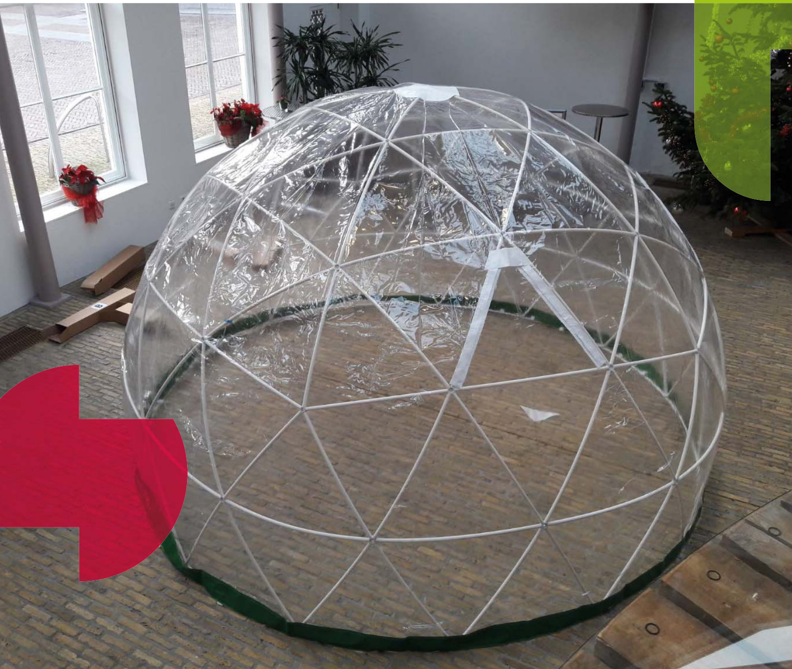
De pop-up bubbel

Dus zie jij de bubbel komend jaar zomaar ergens verschijnen? Stap binnen! Geniet van het talent en de cultuur die Súdwest-Fryslân te bieden heeft!