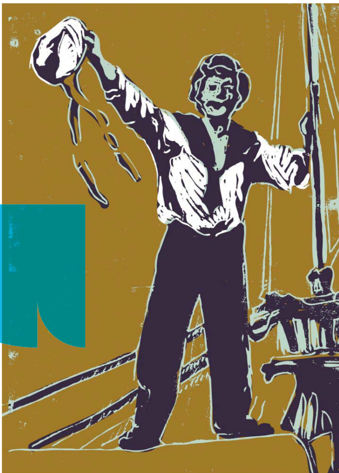
Under de Toer Arum

tot stand wordt gebracht. Theatergroep SULT zal een kern van het verhaal voor haar rekening nemen. BUOG bedenkers en uitvoerders van ongewone gebeurtenissen verzorgt het leeuwendeel van de productie. Een uniek samenwerkingsproject van tien culturele instanties in de gemeente.