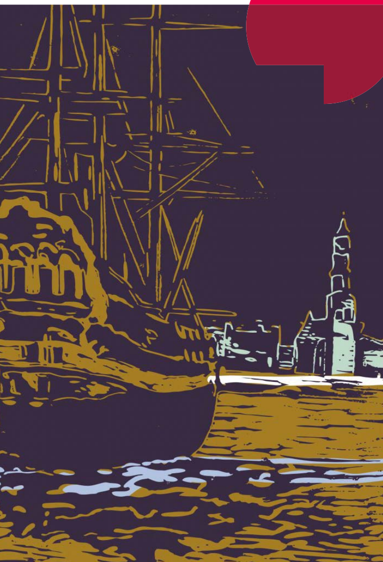
Under de Toer Sânfurd

Met de fanfare Eendracht Maakt Macht, Popkoor Aldegea, de Toneelvereniging en beeldend kunstenaar Gerrit Terpstra. Artistieke leiding en regie: Peer van den Berg (SuverNuver).