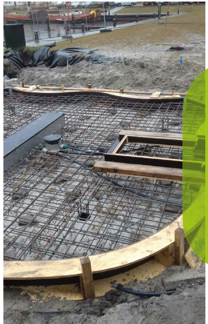
betonnen schild (Workum)

Stand van zaken: De boom zit in een schip, evenals de stenen. Beide zijn onderweg van China naar Rotterdam. De stenen worden eerst naar het terrein van de Boer en de Groot in Workum gebracht. Gelukkig komt Shen Yuan ook deze kant op, zodat ze het technisch team van informatie kan voorzien. De boom wordt afgeleverd bij Blom in Hindeloopen, omdat er waarschijnlijk nog wat laswerk aan verricht moet worden. Op 14 maart is de pompput geplaatst en hierop aansluitend zal de aannemer een betonnen vloer storten op de plek van de boom en het water.