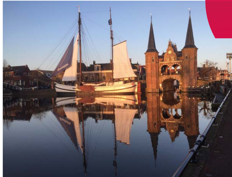
de Tromp bij de Waterpoort in Sneek

planning is krap, maar aannemer Nota uit Sneek, samen met Stienstra v/d Wal uit IJlst, graven, plannen, meten en straten met veel enthousiasme dat het allemaal zeker voor 18 mei klaar is. Friso uit Sneek begint binnenkort met de betonnen bak en de schaal voor de bloemen. Ook dat loopt volgens planning. Alle nieuwe bomen zijn al besteld. Voor de klanten van de Fysiotherapeut en bezoekers van de Utherne is er dus nog even overlast.